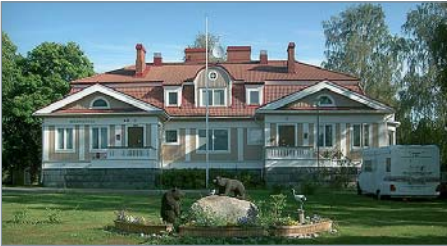
Pienryhmäkoti Helmiina Oy